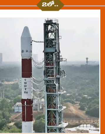
పీఎస్ఎల్వి సీ59 ప్రయోగం వాయిదా