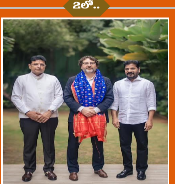
షిషియా పసిఫిక్ జోన్లో రెండో సెంటర్