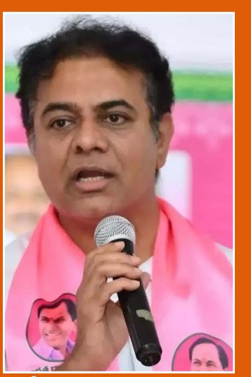
వచ్చే ఏడాది నుంచి పెద్ద ఎత్తున సాంస్కృతిక కార్యక్రమాలు