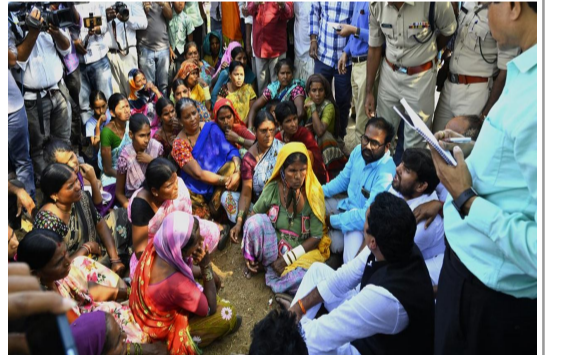
లగచర్ల గిరిజనుల పై పెట్టిన కేసులను వెనక్కి తీసుకొని జైల్లో నుండి బయటకు వదలాలి.

హైదరాబాద్ : లగచర్ల లో ఫార్మా కంపెనీ పెట్టము అని వెనక్కి తగ్గిన రేవంత్ రెడ్డి. ఆనాటి దగ్గర విరాళం తీసుకున్న 100 కోట్లు రిటర్న్స్ ఇస్తామన్న రేవంత్ రెడ్డి హైద్రా పనులు నిలిపివేసిన రేవంత్ రెడ్డి. మానీ పునరుజ్జీవనం మూడుమర్సిన రేవంత్ రెడ్డి మీ రాజకీయ ఎత్తుగడల కోసం అవతల వారిని చిత్తు చేయడం కోసం వ్యక్తిగత కక్షల కోసం లగచర్ల రైతులు ఎందుకు బలి కావాలి. వెంటనే వారిపై కేసులు ఎత్తివేసి వారిని జైలు నుండి బయటకు వదలాలి నాపైన 150 కేసులు అని చెప్పుకోవడం గొప్పకాదు వారు ఏం తప్పు చేశారు వారు ఎందుకు జైల్లో ఉందా రేవంత్ రెడ్డి ఇంటి మీదికి దౌర్జన్యంగా ప్రభుత్వ పెద్దలు పోయి ఇల్లు ఆక్రమిస్తే గుంజుకుంటే తిరగబడదా? కాంగ్రెస్ పార్టీ మంత్రుల ఫామ్ హౌస్ ల పైకి పోయి లాక్కుంటే తిరగబడదా? మరి లగచర్ల గిరిజనులు తిరగబడడంలో తప్పింది. వారిపై కేసులు పెట్టడం ఎంతవరకు కరెక్ట్ చాలా అంశాలలో ప్రభుత్వం వెనక్కి వెళ్లిన తర్వాత అలాగే ఈ విషయంలో కూడా